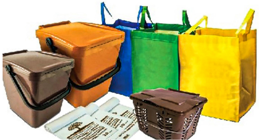
Un exemple de contenidors domèstics.

La primera de les accions que impulsa el govern local són tres xerrades adreçades als industrials i empresaris i als veïns en general, aquest divendres i dissabte, 21 i 22 de gener, a la sala d'actes de l'Ajuntament de Llivia. La primera sessió, a les 16 hores (per a empresaris i industrials i restauradors) i la segona