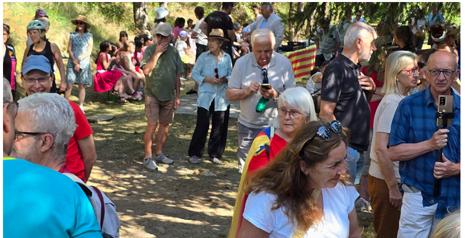
Imatges de la jornada de la Flama, a Estavar