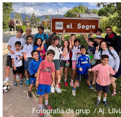
Fotografia de grup