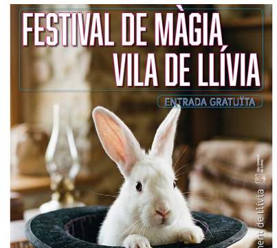
Cartell del festival d'aquest any.