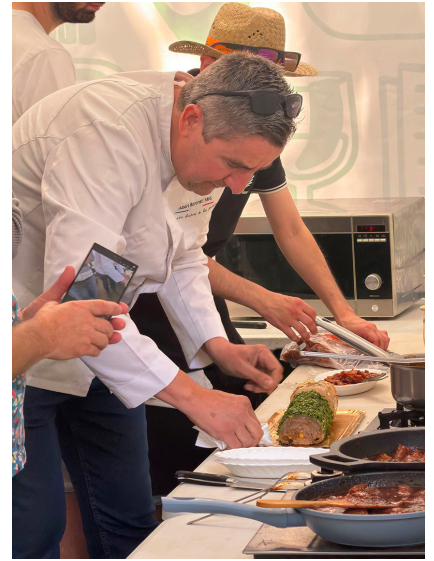
Boronat, a Igualada / Aj. Llívia

Just uns dies després, a la primera edició de CharcutExpo, que es va dur a terme a Madrid, el xef llivienc va ser premiat amb la distinció Dues Joies de la xarcuteria. Segons detalla el web de la fira, els Premis Joies de la Xarcuteria busquen impulsar l'evolució del sector, fomentar les bones pràctiques i servir com a aparador de referència. "Els premis volen destacar un ofici que forma part de la nostra cultura gastronòmica i que avui viu un moment decisiu. Volem reconèixer els qui estan portant la xarcuteria a un altre nivell, des de la qualitat del producte fins a la innovació en el punt de venda, l'atenció al client i la capacitat de construir negocis més competitius i reconeixibles", diu al web de la fira. En aquest escenari, la primera edició de la