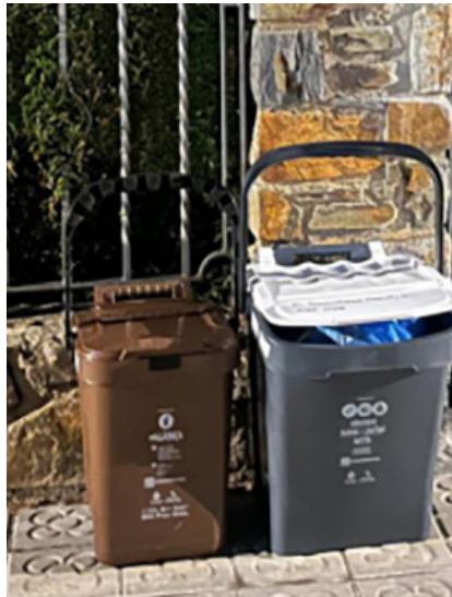
Bujols als carrers de Llivia

Aquestes dades són xifres de rècord a Llivia i avalen que la recollida selectiva del porta a porta funciona, més enllà de les imprecisions i errors del servei